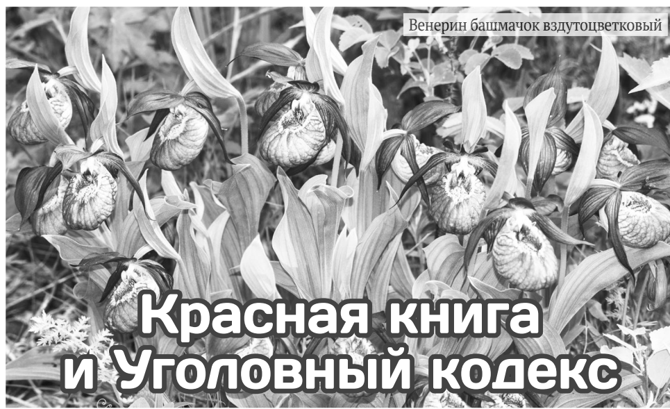
Венерин башмачок вздутоцветковый

Первым делом успокоим грибников. Виды неслучайно попали в Красную книгу. Они действительно редки, и шансы положить в корзинку краснокнижный гриб практически равны нулю, особенно учитывая традици-