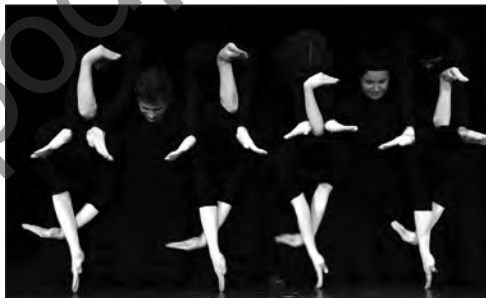
Театр «HAND MADE» (Санкт-Петербург)