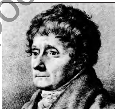
Фридрих Реберг. Портрет Сальери (1821)

«Аксур» стал любимой оперой Иосифа II и превратился в почти официальный символ монархии. Таким образом, во время войн против революционной Франции опера под разными названиями исполнялась по обе стороны линии фронта. И когда генерал Бонапарт основал в Италии так называемую Цизальпинскую Республику, это историческое событие также было отмечено постановкой в «Ла Скала» 10 июня 1797 года оперы Сальери. Репертуар Парижской оперы «Тарар» украшал вплоть до 1826 года. «Аксур» на немецкой сцене шел до середины XIX века.