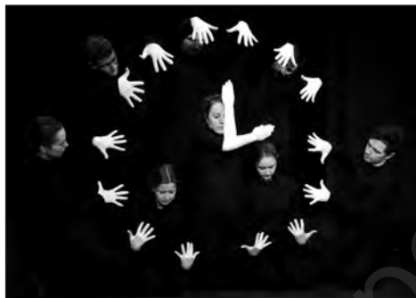
Театр «HAND MADE» (Санкт-Петербург)

«Их никто этому специально не учил, не заставлял. Просто они подставили плечо, приняли ответственное решение. И мне как руководителю это было очень приятно и радостно видеть».