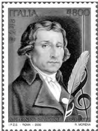
Марка, посвященная юбилею

Сведения об этом периоде жизни Антонио Сальери весьма обрывочны, но доподлинно известно, что родился он 18 августа 1750 года в многодетной семье состоятельного торговца колбасами и ветчиной в итальянском местечке Леньяго недалеко от Венеции.